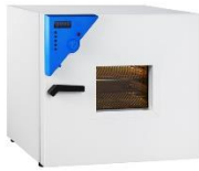
قابلیت نصب درب فلزی با قاب شیشه ای جهت مشاهده محفظه داخلی در صورت سفارش