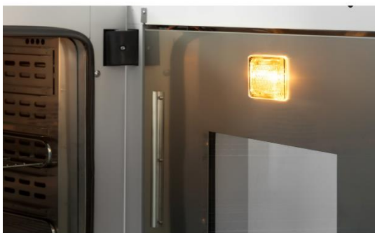
قابلیت نصب لامپ در صورت سفارش