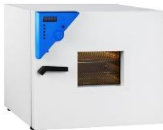
قابلیت نصب درب فلزی با قاب شیشه ای جهت مشاهده محفظه داخلی در صورت سفارش