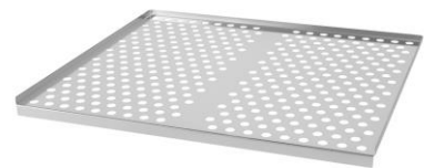
قابلیت قرار دادن سینی مشبک در صورت سفارش